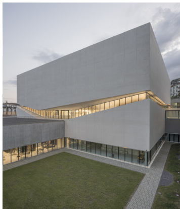
Neues Kunstquartier, Lausanne