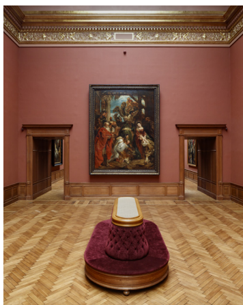
Royal Museum of Fine Arts, Antwerpen

en. Es wirkt etwas irritierend, eher wie Science-Fiction, und der Mensch darin als Homo aquaticus – aber Science-Fiction hat uns gelehrt, dass so manche fiktive Idee nicht immer eine Utopie bleibt. Doch weil das und auch Themen wie das Metaversum noch dauern werden, wünschen wir Ihnen jetzt erst mal ein großartiges neues Jahr 2023 und viele einzigartige Momente. Ach, du liebe Zeit, ich habe etwas vergessen, fahren Sie nach Lausanne, das neue Kunstquartier ist großartig. Happy 2023.