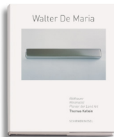
Walter De Maria, Schirmer/Mosel