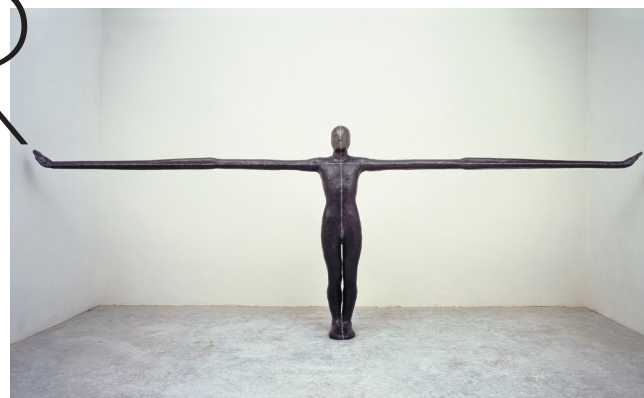
Anthony Gormley, Field , 1984