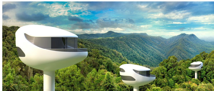
Ocean Builders – neue ökologische Architektur